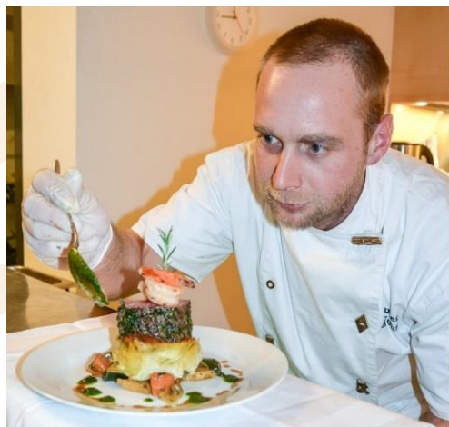
Alfons Gruber / Inh. Herzog Catering