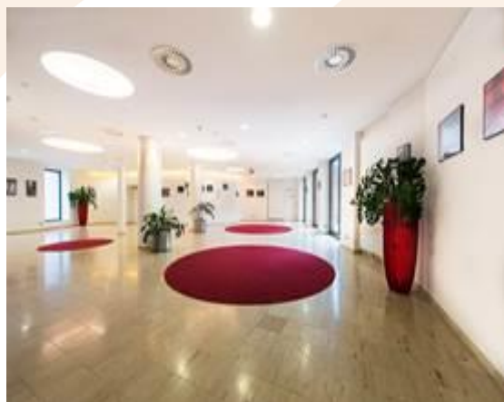
Foyer im Congress Saalfelden mit 500qm

Zur Jahresmitte 2017 geht ein lang gehegter Wunsch unserer Kunden in Erfüllung, das bestehende Congress Foyer wird auf großzügige 500 m 2 vergrößert und kann dann optimal für Industrieausstellungen und als Cateringbereich genutzt werden.