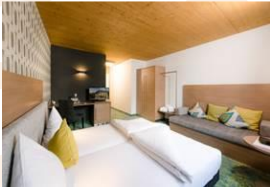
‚die hindenburg‘ Zimmer NEU