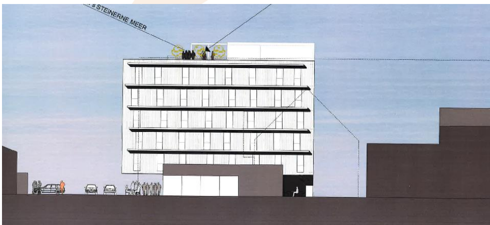
Studie Congress Hotel Saalfelden - ab 2019

Blickt man noch weiter in die Zukunft steht auch ein Hotelneubau an. Bis Anfang 2019 entsteht das Congress-Hotel Saalfelden, ein zweites direkt mit dem Kongresszentrum verbundenes Hotel mit 70 Zimmern und 100 Tiefgaragenplätzen.